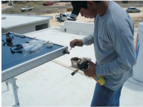
Paso a Conectores rosca interior