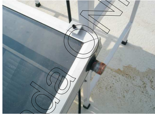
Paso b Tapas