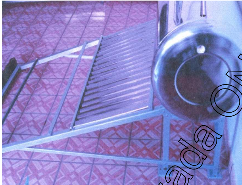
Figura 2 Armado del "Calentador Solar" (parte frontal)