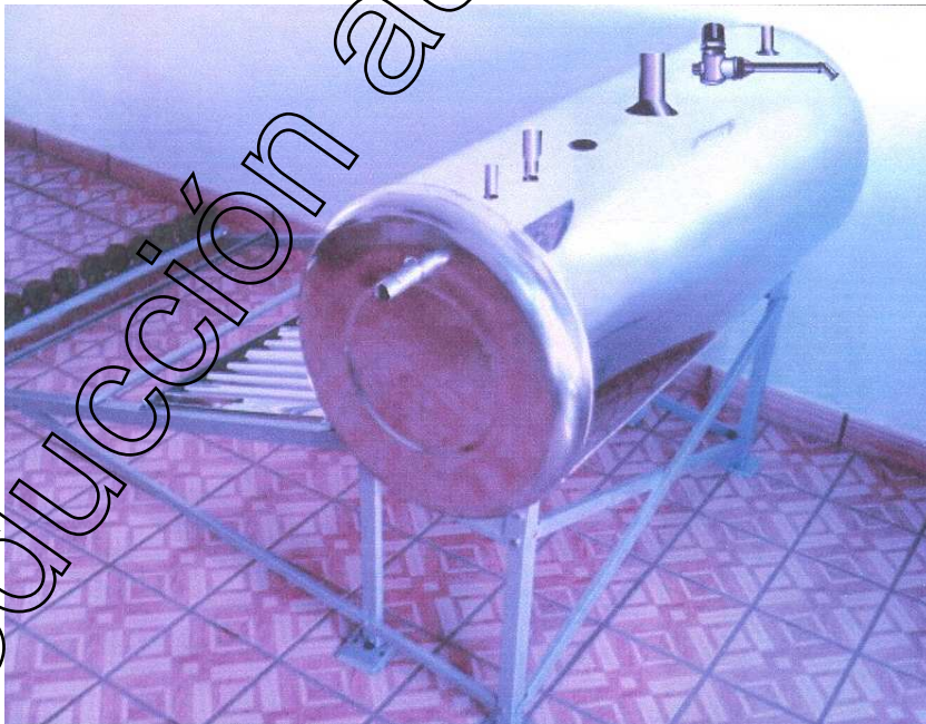
Figura 1 Armado del “ Calentador Solar ” (parte trasera)