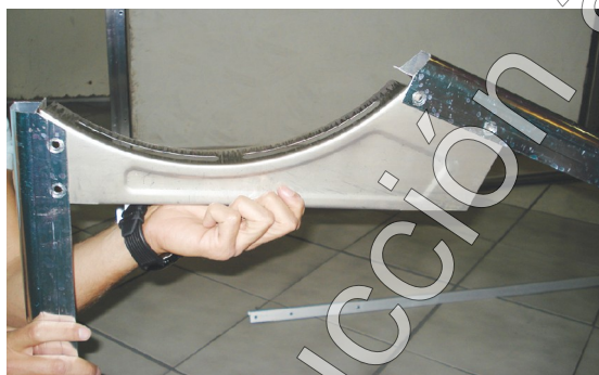
Figura 2 Soportes de termotanque

3. Una vez colocado la barra de aluminio lateral, el soporte del termotanque y la pata, para cada extremo, colocar los dos soportes de aluminio, en cada extremo de la estructura (ver figura 3). Verificar que estén bien atornillados.