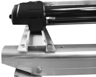
Figura 5 base sujetadora de tubos de vacío

7. Colocar la barra sujetadora de tubos de vacío uniendo las barras laterales por la parte inferior (ver figura 5).