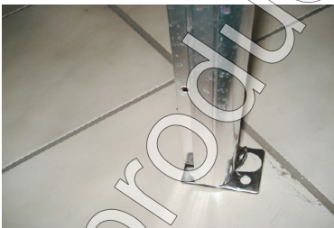
Figura 6 Ancla

11. Revisar que los tubos de vacío se encuentran perpendiculares a los soportes laterales, esto se logra observando el equipo desde un costado. De no encontrarse perpendiculares, rotar el termotanque para lograr posicionarlos de la forma antes mencionada.