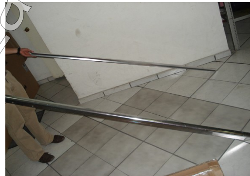
Figura 1 Barras de aluminio laterales

2.- Colocar los soportes del termotanque y fijarlos con los tornillos, así mismo colocar y fijar al otro extremo de cada uno de los soportes del termotanque dos soportes que sirven como patas del “Calentador Solar” (ver figura 2).