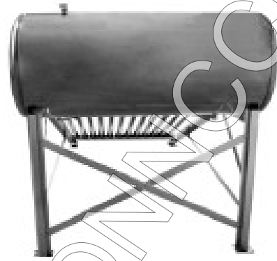
Figura 4 Barras traseras

14.- Impermeabilizar el área alrededor y por encima del ancla, para evitar futuras penetraciones de agua.