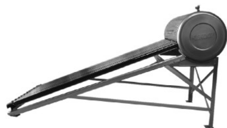
Figura 3 Soportes de aluminio

3. Una vez colocado la barra de aluminio lateral, el soporte del termotanque y la pata, para cada extremo, colocar los dos soportes de aluminio, en cada extremo de la estructura (ver figura 3). Verificar que estén bien atornillados.