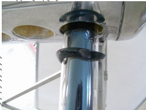
Figura 3 ajuste del tubo de vacío en el soporte inferior