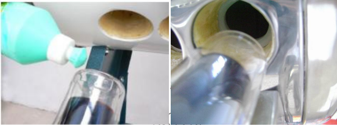
Figura 2 colocación del tubo de vacío