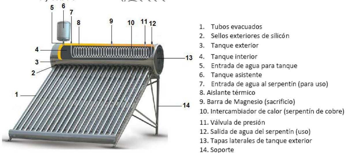
Figura 1 Armado del “Calentador Solar”