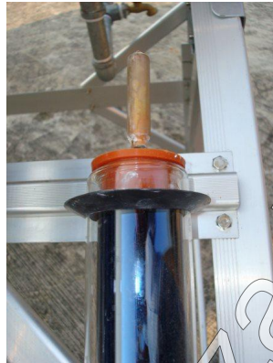
Figura 2 colocación del sello de silicón