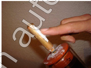
Figura 3 aplicación del silicón termo conductor