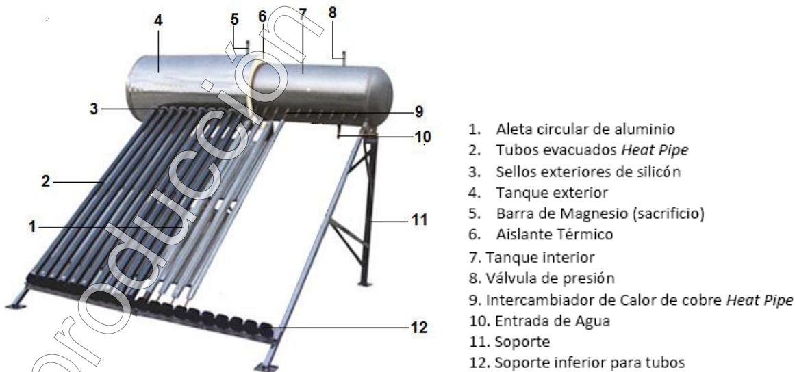
Figura 1 Armado del “Calentador Solar”