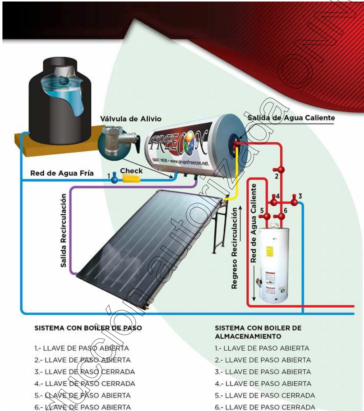
Diagrama 1 Instalación hidráulica

Realizar la instalación hidráulica del “Calentador Solar” de acuerdo al diagrama 1.