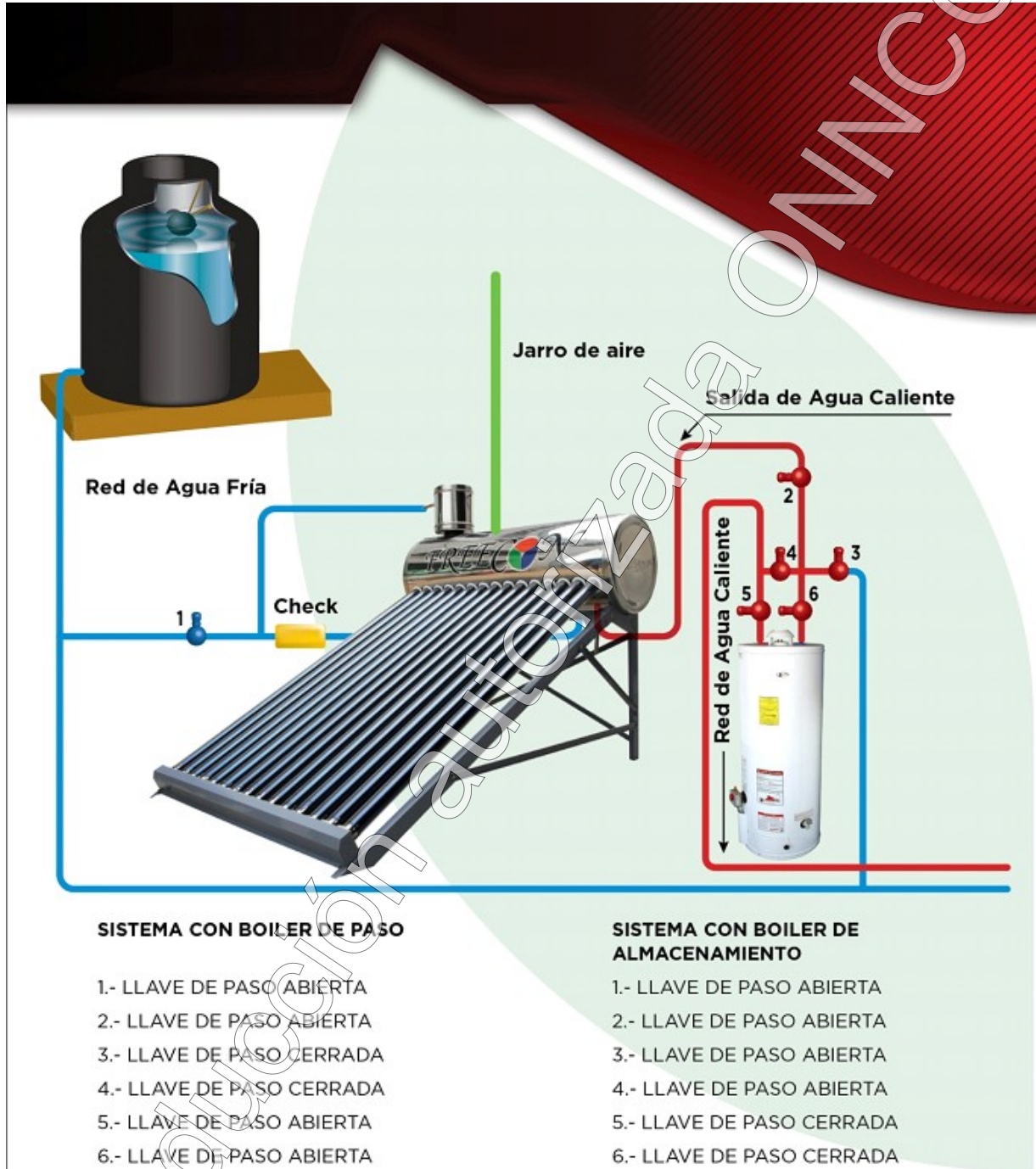
Diagrama 1 Instalación hidráulica

Realizar la instalación hidráulica del “Calentador Solar” de acuerdo al diagrama 1.