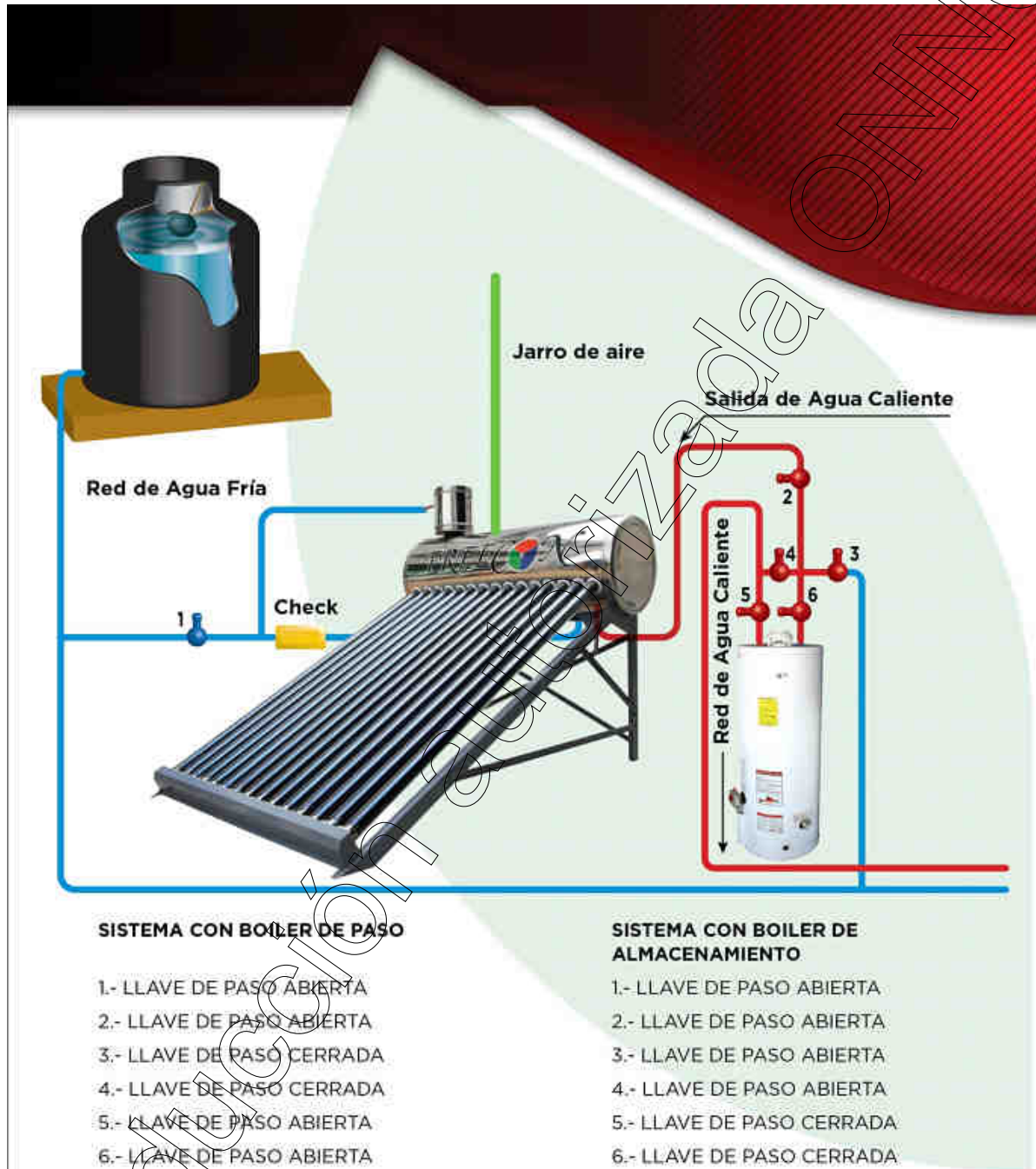
Diagrama 1 Instalación hidráulica

Realizar la instalación hidráulica del “Calentador Solar” de acuerdo al diagrama 1.